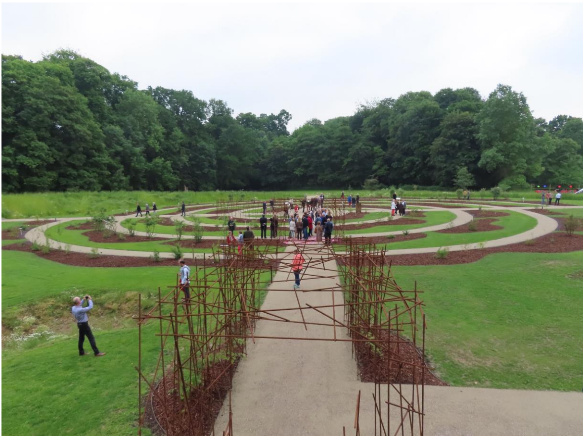
Zo ziet de 'wadi' (binnencirkel) van de rozentuin er momenteel nog uit

Nu zijn de serres helemaal gerenoveerd en een bezoek meer dan waard!